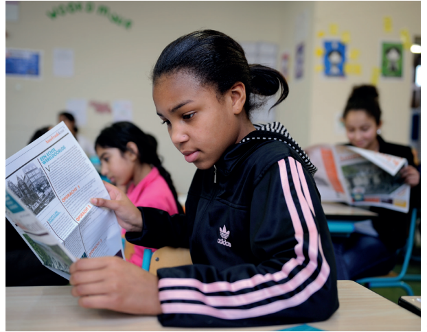
Een leerling uit groep 8 leest de Anne Frank Krant .