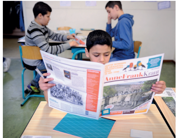
Een leerling uit groep 8 leest de Anne Frank Krant .