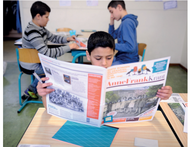
Een jongen uit groep 8 leest de Anne Frank Krant .

Er zijn twee varianten uitgewerkt, waardoor het onderwerp breder belicht wordt. In variant A stellen studenten zelf criteria op voor het gebruik van beelden van de Jodenvervolging. Variant B richt zich op het omgaan met reacties van ouders aan de hand van twee sprekende casussen. De varianten duren ieder ongeveer 30 minuten. Studenten hoeven zich niet voor te bereiden.