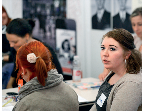
Pabo-studenten tijdens een bezoek aan het Anne Frank Huis.