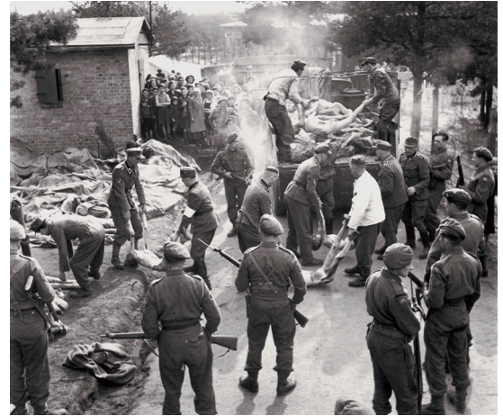
Britse soldaten dwingen voormalige kampbewakers van Bergen-Belsen om de doden te begraven. Foto en bijschrift uit het educatieve dagboek, zie casus 'Mijn dochter is zich rot geschrokken'.