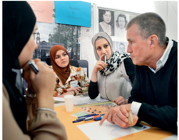
Pabo-opleider en -studenten discussiëren tijdens een bezoek aan het Anne Frank Huis.